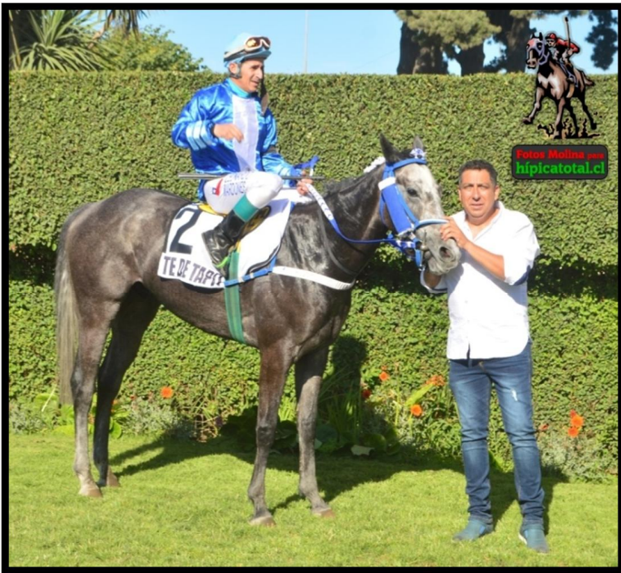
TE DE TAPIT el mejor representante del stud CALUFO