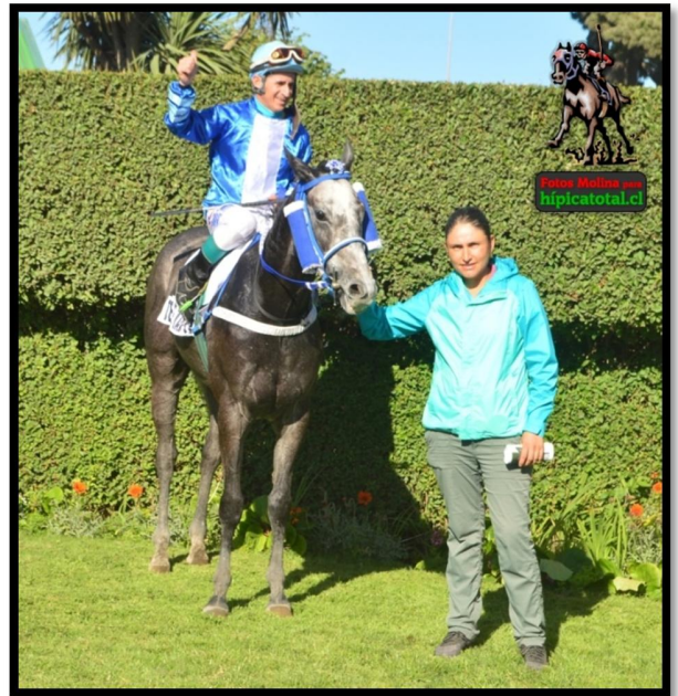
El hijo de FAST COMPANY logra la segunda victoria de su campaña